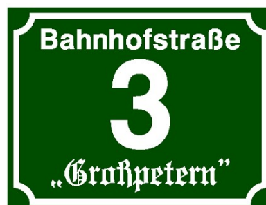
Hausnummer mit Hausname